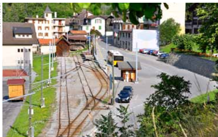
La gare actuelle. Son hangar, son cabanon voyageurs et ses trois voies ne seront plus qu'un souvenir.

Autre commodité des plus utiles, un panneau électronique informera en continu les voyageurs sur le départ des trains, les retards, les imprévus, etc. Quant au cabanon en bois qui sert actuellement d'abri pour les usagers des trains et des bus, il sera supprimé en raison des multiples dégradations dont il a été l'objet. En cas de