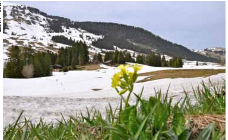
Le plateau des Mosses: «Interdiction d'en modifier le terrain sous une forme ou sous une autre», dit la Constitution.

Confédération, sans aucune concertation avec les acteurs locaux. Choc pour Les Mosses: une grande partie de son plan d'extension est mis sous protection, dont l'ensemble des remontées mécaniques, les campings, etc. Dès cette date, séances, groupes de travail, conciliation, mise à l'enquête, recours, annulation ont occupé municipaux et acteurs du plateau des Mosses. Mais à ce jour, je dirais que nous en sommes presque à la case départ, puisqu'à la fin