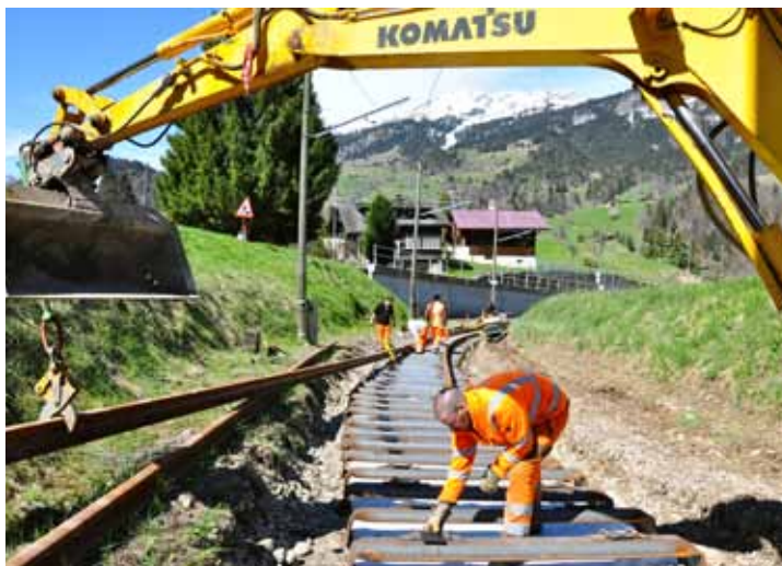
Les ouvriers en pleine opération de remplacement des voies sur une distance de 800 mètres, peu après le Pont des Planches.

Les traverses et le ballast sont également remplacés. Les nouveaux rails pèsent 47 kg au mètre, contre 30 kg pour les anciens. Ils reposent sur des traverses en fer, contrairement au tronçon Pont des Planches - Le Sépey, changé l'an dernier, dont les traverses sont en bois, afin d'atténuer le bruit du passage des trains près des habitations.