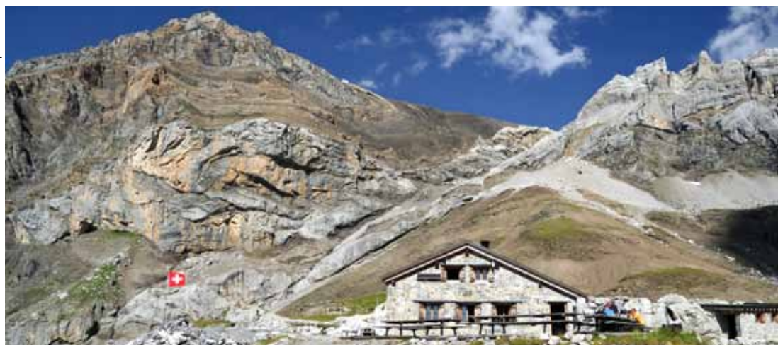
Pierredar avec - rochers clairs au-dessus du toit - la ferrata et le passage des «Dames anglaises».

Dans son rapport, le Président Bernard Hähni a présenté le projet de création d'un droit de superficie pour la construction d'une annexe au refuge, servant de WC et de bûcher.