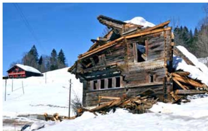
Le poids de la neige a été plus fort que le poids des ans.