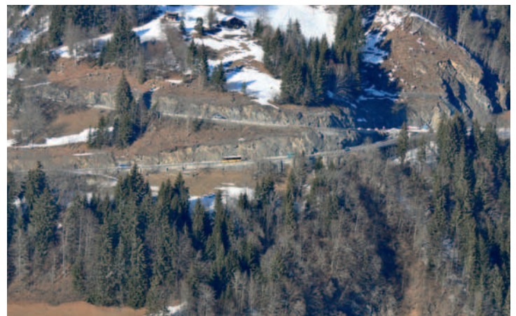
Vue générale sur les importants travaux (abattages d'arbres et pose de filets) déjà effectués aux abords de Champ-Pèlerin.