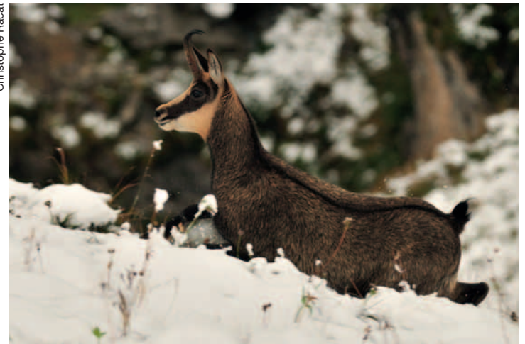
Ce magnifique chamois perd énormément de forces si, d'aventure, il est obligé de s'enfuir dans la neige.

Les tétras et autres lagopèdes vivent sous la neige dans des