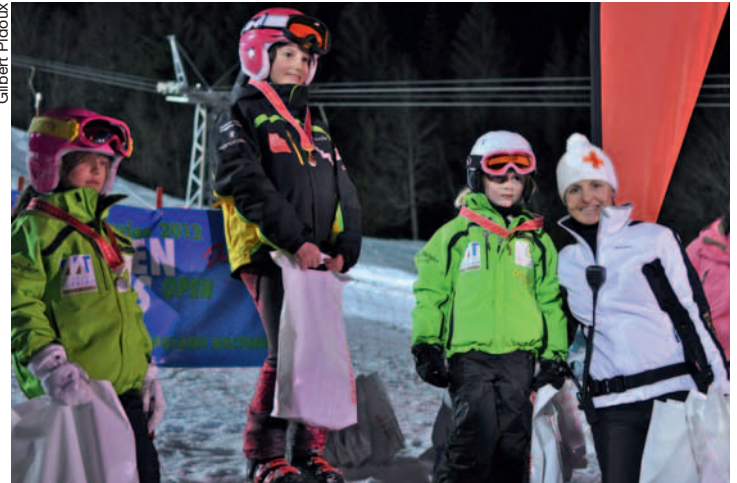
Les petits sont émoustillés par les prix tant attendus, distribués par Erika Hess en personne.

Même la RTS (Radio Télévision Suisse) était de la partie. Ou plutôt, aurait dû être de la partie. Car si elle était bel et bien sur place pour faire un reportage sur l'Erika Hess Open,