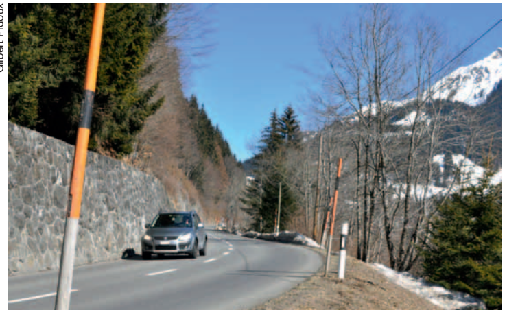
2012-2013, les bûcherons interviendront aux Caudreys.