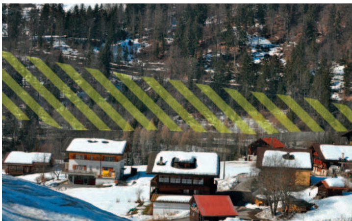
2012-2013, Le GFLO sera à l'œuvre sur la bande boisée, située entre la route du Sépey et celle de Cergnat.