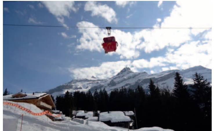
Isenau, incomparable pour les skieurs débutants et les familles.

remplacement du téléski du Laouissalet temporairement de côté pour être certains de l'englober correctement dans le nouveau projet de liaison avec le domaine de Villars.