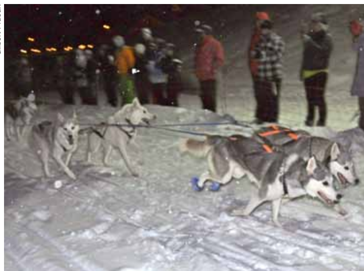
L'attelage, parti de Leysin, est en vue de l'arrivée au col des Mosses... après 25 km de course nocturne!