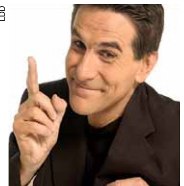
Tex est aussi présentateur à la télévision française.

Prix: CHF 30.- par adulte et CHF 15.- par enfant.