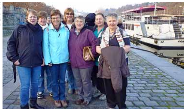
La délégation des Paysannes ormonanches à Prague.