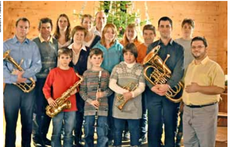
L'Echo du Chamossaire participe à la vie villageoise, ici au Noël à la chapelle de La Forclaz (voir www.lecotterg.ch ).

Depuis, l'Echo du Chamossaire va son bonhomme de