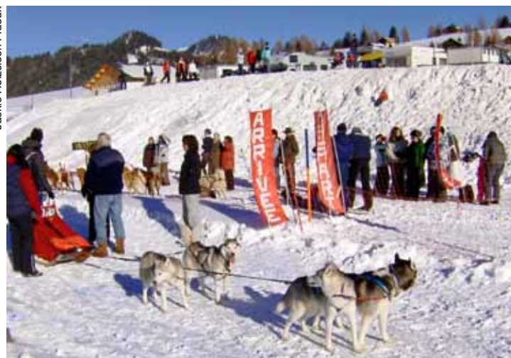
Le public est toujours impressionné par la performance athlétique des chiens de traîneau.

Mardi 31 janvier , les classes de Leysin seront invitées à passer la journée avec les attelages et à s'initier aux techniques de la discipline. Le départ de la 1 ère étape sera donné à 16h45. Elle conduira les attelages de Leysin aux Mosses par la Pierre du Moëllé, sur un tracé très varié long de 25 km. L'arrivée aux Mosses est prévue aux environs de 19h00, donc de nuit.