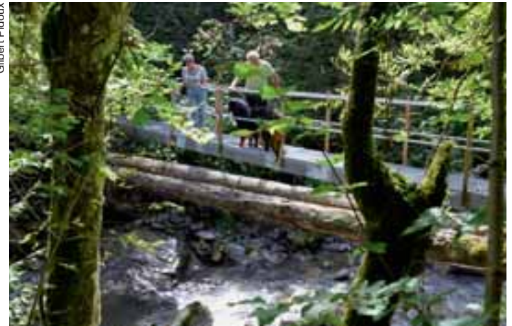
Une solide passerelle métallique franchit la Grande-Eau.

Dans l'autre sens, depuis les Fiodeyres, le sentier utilise, sur 500 m environ, la vieille route des Diablerets qui longe la RC actuelle par l'aval, avant d'effectuer un brusque coude et de descendre jusqu'à la Grande-Eau qu'il franchit grâce à une solide passerelle métallique. Il remonte sur l'autre versant et traverse perpendiculairement la ligne ferroviaire