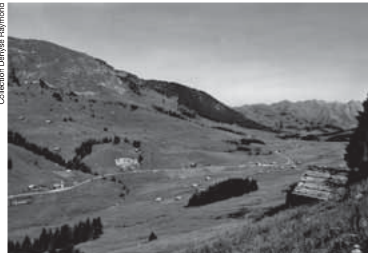
Collection Denyse Raymond

Les signes de la modernité sont encore ténus: aux Fontaines, des garages ont fait disparaître la scierie. Les pylônes de la ligne électrique à haute tension se dressent déjà. Les toutes premières