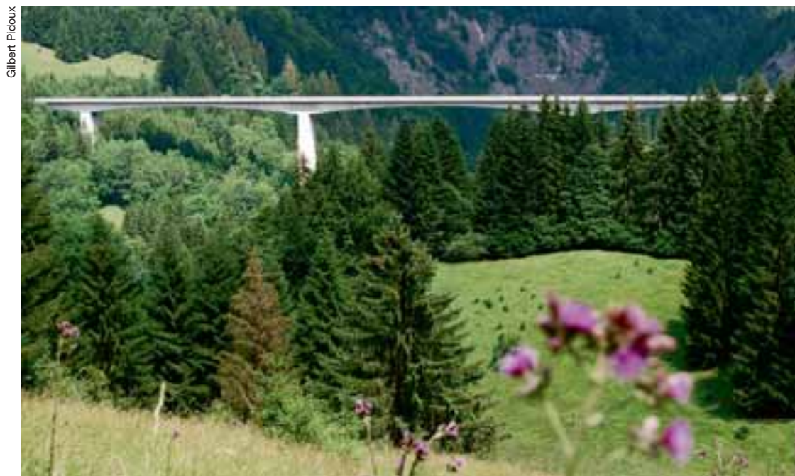
Le pont d'Aigremont, un symbole que Le Cotterg a pris comme trait d'union intercommunal, reliera-t-il un jour deux parties d'une même commune?

C'est parti! L'étude de faisabilité relative à la fusion éventuelle des communes d'Ormont-Dessus et d'Ormont-Dessous a démarré le jeudi 1 er septembre par une réunion de travail regroupant les deux Municipalités. Un organigramme, définissant six secteurs principaux à étudier dans un premier temps, a été élaboré (voir page 2).