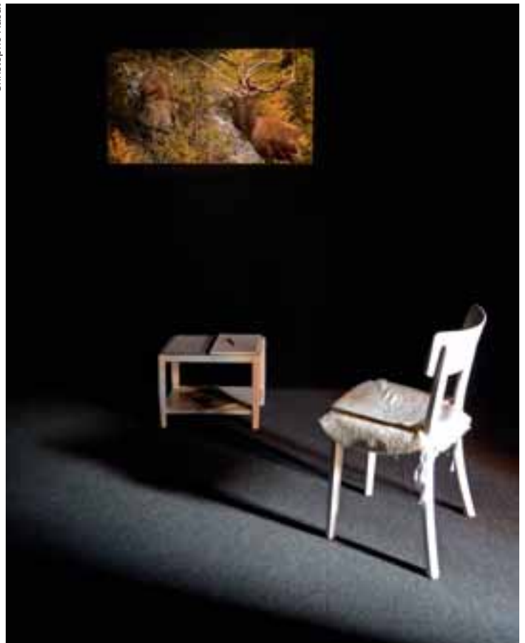
Claude Morerod n'est plus, mais son œuvre magnifique reste.