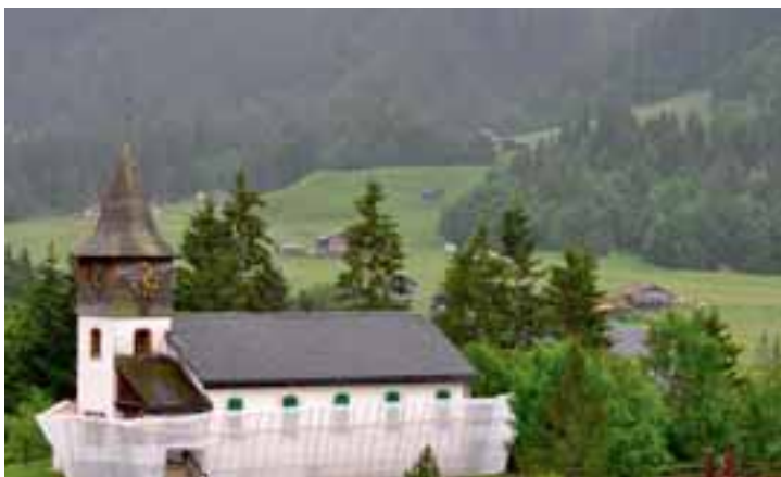
Pour l'occasion, la chapelle des Diablerets a été transformée en Arche de Noé.

Les Diablerets | Aventure exceptionnelle pour les enfants