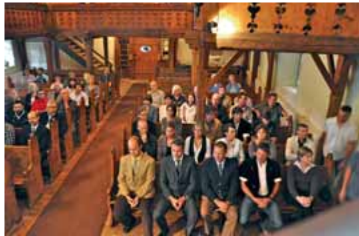
Une assemblée empreinte d'émotion dans le vénérable temple de Vers-l'Église.