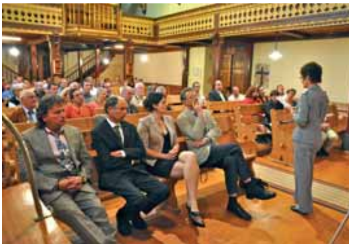
Ambiance solennelle, là aussi, dans l'église de Cernat, où manquait tout de même le gendarme en costume d'apparat.