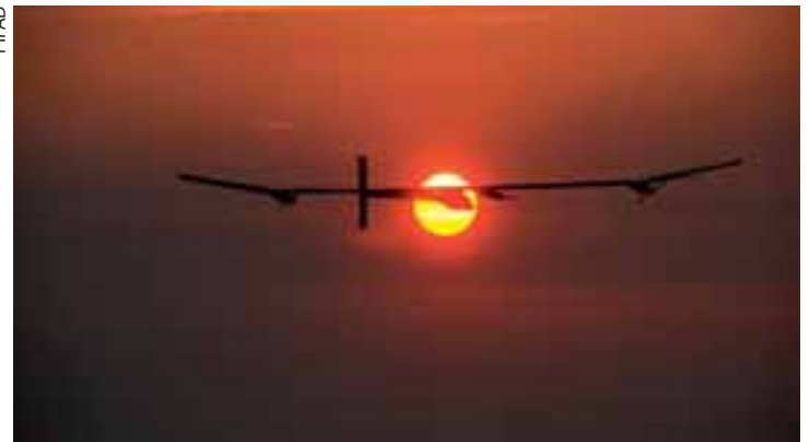
Solar Impulse fait partie de la grande aventure humaine.

Hommage lui sera rendu le dimanche 7 août. Cet événement ne comblera pas le vide, mais permettra de se dire qu'il faut mettre inlassablement nos pas dans ses pas, qu'il a fait la trace pour regarder vers