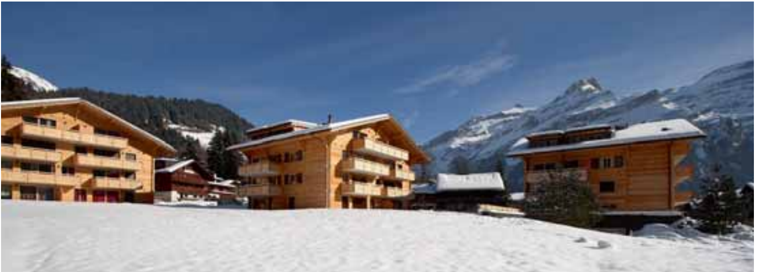
Les chalets «Mon Abri», une réalisation de DVVM, donne un coup de jeune à l'entrée du village.