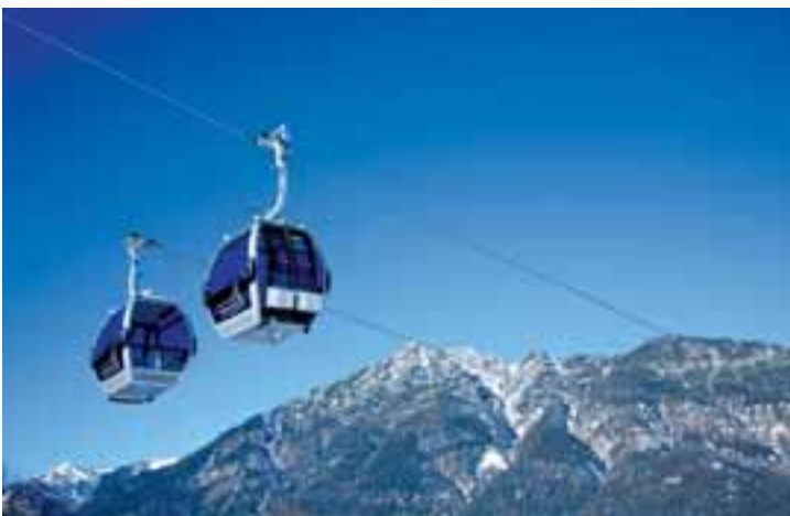
«Ce type de télécabine à huit places est prévu à Isenau.»

Ces travaux devraient durer environ 18 mois pour une réouverture du bâtiment début 2013.