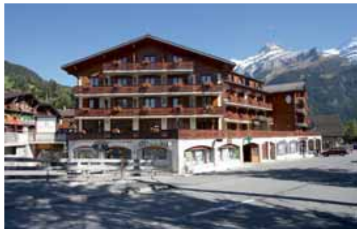
La rénovation de l'Hôtel du Chamois a été effectuée en 2006.