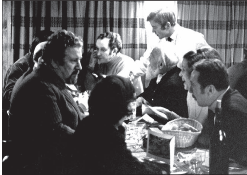
Sir Peter Ustinov lors du premier concert Musique et Neige de 1970 aux Lilas

Le repas habituel suivant le concert sera animé par l'Alarm Jazz-Band, cher au coeur de ceux