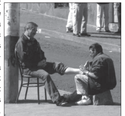
A Quito, le cabinet du rebouteux est sur la rue... Insolite!

7h30, départ de Genève avec Air France pour Quito via Paris et Bogota où nous arrivons à 18h00, avec 7 heures de décalage, soit 17 heures de vol. Excellent voyage, nous nous posons en douceur en plein centre ville. Transfert à l'hôtel, un joli petit hôtel avec chambres au fond d'une petite cour intérieure arborisée. Là nous sommes d'abord reçus avec les précautions d'usage dans les environs soit: une sonnette qui permet à la réception de débloquent la porte de l'intérieur via un ingénieux système de ficelles, de poulies et de ressorts et ceci plutôt deux fois qu'une puisque, arrivés à l'étage, rebelote.