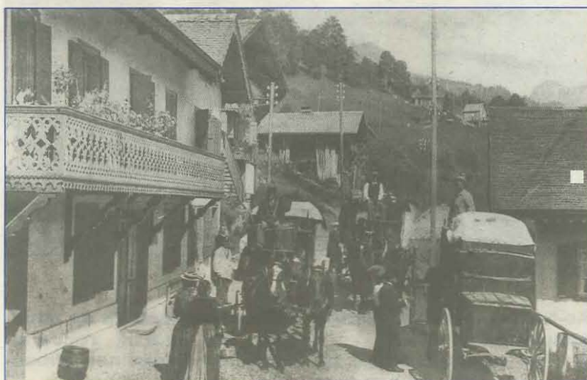
Bureau postal de Vers-l'Eglise (non daté)

c'est évidemment à côté de la gare de l'ASD que la poste s'installe en 1914.