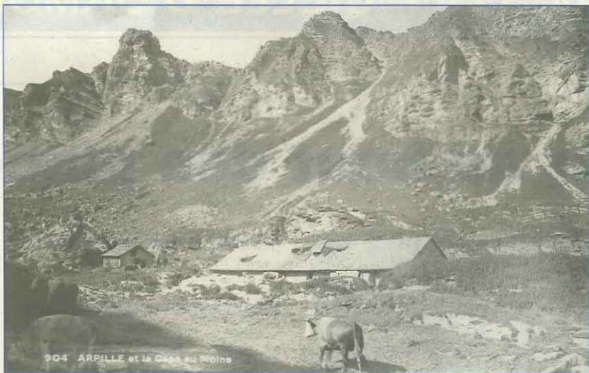
La Grande Arpille

Après avoir passé un clédar, vous voilà arrivés à la « Montagne » de la Grande Arpille, endroit spécialement cher dans le cœur des Ormonans. Réputé pour la finesse de son herbage, il pouvait accueillir une cinquantaine de vaches. La fabrication du fromage, que l'on descendait à dos d'homme, s'y est faite jusque vers 1960 ; actuellement, il n'y vient plus que du jeune bétail.